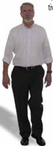
Yves DUTEL, Maire de Mornant