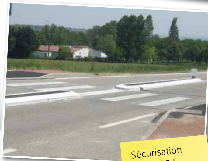
Sécurisation de la RD34