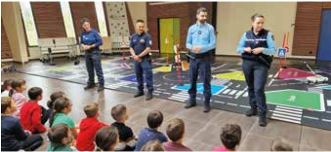
Édition 2024 : Passage du permis modes doux

04 78 44 00 64 - bta.mornant@gendarmerie.interieur.gouv.fr