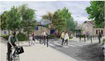
Vue avant et après, au croisement du chemin du Stade et de l'avenue de Verdun