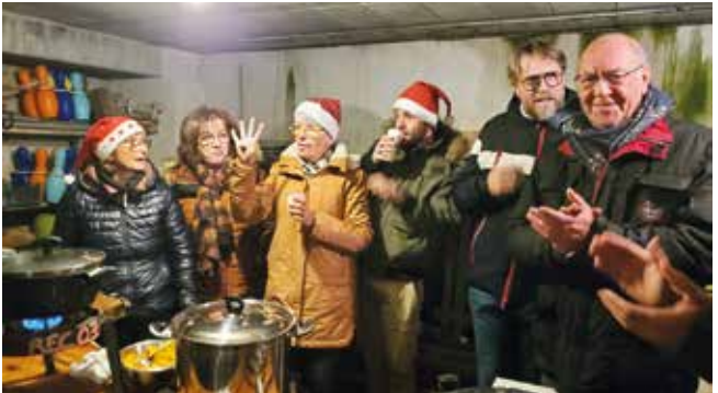
Quartier La Pavière