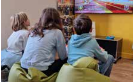
À la découverte de nouveaux univers