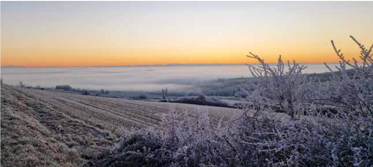
➤ Mornant, la tête dans les nuages, décembre 2024

L’intelligence artificielle (IA) s’impose désormais dans notre quotidien, bouleversant nos habitudes, nos métiers et notre rapport à l’information. De la santé à l’éducation, en passant par la sécurité et la culture, aucune sphère de la société n’échappe à son influence grandissante. Pourtant, cette révolution technologique suscite autant d’enthousiasme que d’inquiétudes. Entre promesses d’un monde plus efficace et craintes d’une déshumanisation progressive, les citoyens doivent aujourd’hui relever de nombreux défis pour s’adapter à cette ère nouvelle.