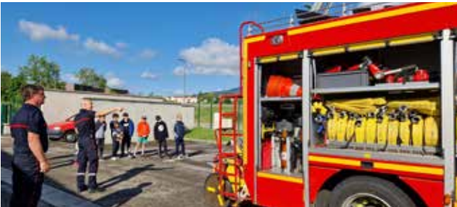
Édition 2024 : Visite de la caserne des pompiers