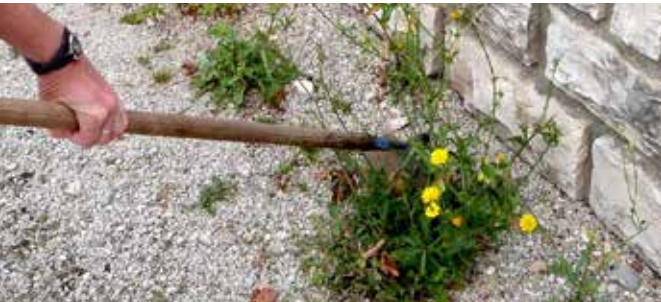
Désherbage à la binette

Nous vous rappelons que chaque citoyen est responsable de la propreté autour de son domicile, ce qui inclut le balayage, le lavage, le retrait des déchets et le désherbage. Cela s'applique aux façades, trottoirs et caniveaux, tant sur les voies publiques que privées. L'utilisation de produits chimiques pour désherber est interdite. Si chacun fait un geste, tout devient plus simple !