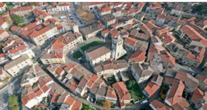
Le PLU dessine les contours de Mornant pour les années à venir

À l'heure de la publication du présent bulletin, l'enquête est envisagée en avril 2025 pour une durée d'un mois. Les dates définitives et les modalités de l'enquête publique seront communiquées par voie d'affichage, de presse et par le site internet de la commune.