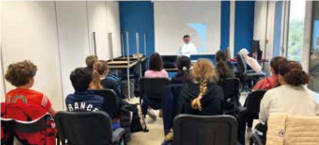
Édition 2024 : Formation gestes de premiers secours