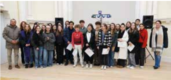
Nos baby-sitters aux côtés des lauréats de la bourse du mérite et de l’engagement