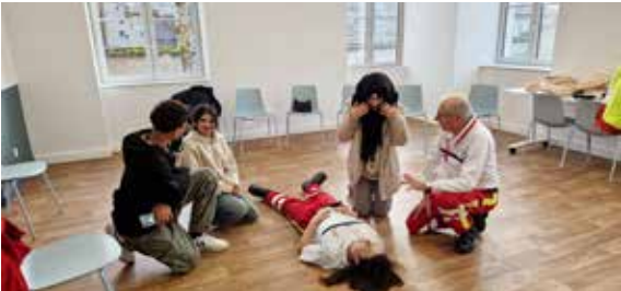
Initiation aux secours à la personne