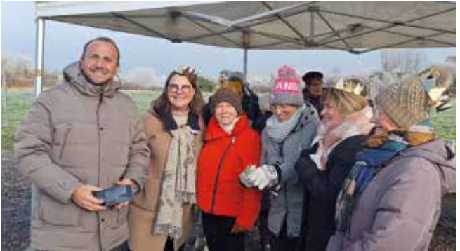
Quartier Germany - Marchay - Le Peu - Chalonnaise

La proximité, ingrédient essentiel à notre qualité de vie