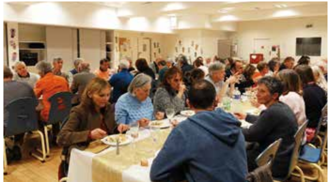
Une belle occasion de se rencontrer et d'échanger

Les prochaines rencontres à ne pas manquer