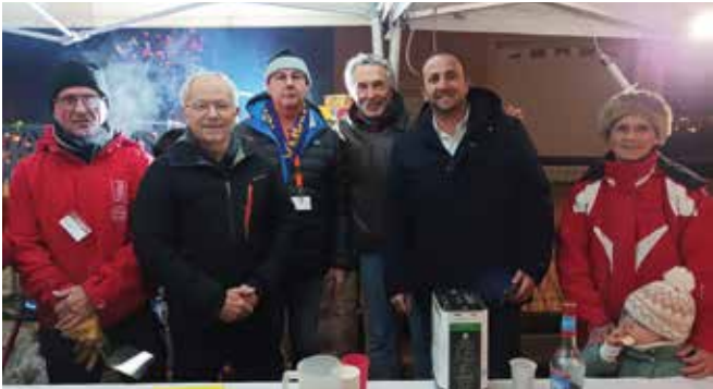
Quartier Les Cariasses - Le Champ

Le délicieux parfum du vin chaud et des marrons grillés a réchauffé certaines soirées de décembre et en janvier c'est la galette qui prenait la relève. L'occasion de se retrouver entre voisins dans une ambiance chaleureuse et festive. Nous tenons à remercier tout particulièrement nos référents de quartier pour leur formidable travail d'organisation. Et bien sûr, un immense merci à tous les Mornantais qui sont venus partager ces instants de convivialité. C'est grâce à votre participation que nos quartiers restent des lieux de vie dynamiques et chaleureux !