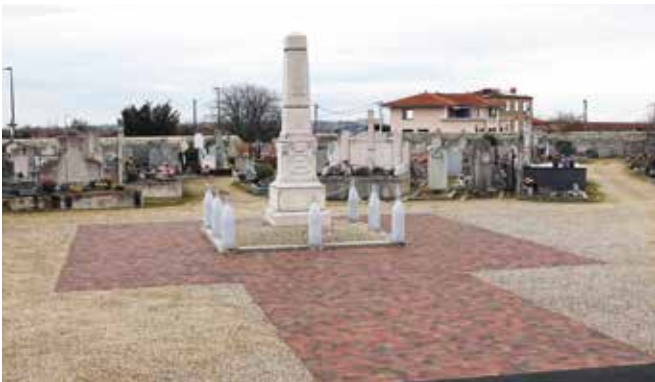
Un aménagement pratique et esthétique

Un grand merci à nos agents pour leur travail de qualité et leur engagement au service de tous !