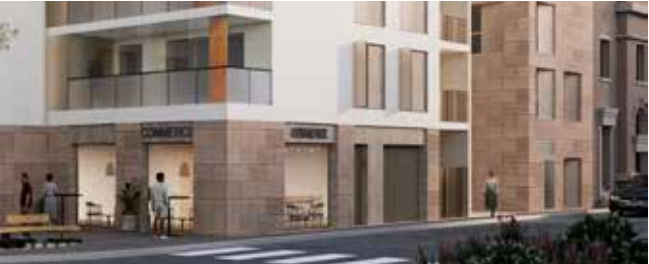
Représentation du projet avenue du Souvenir

Actuellement, les équipes s'attellent à la démolition des bâtiments existants, un processus qui se poursuivra jusqu'au printemps. Par la suite, les travaux de terrassement et de construction prendront le relais. La livraison finale de ce projet ambitieux est prévue pour fin 2026, avec la création de 22 appartements allant du T2 au T4 dont 5 logements à destination des jeunes en prix maîtrisés, ainsi que 6 cellules commerciales en rez-de-chaussée. Ce développement promet d'apporter une nouvelle dynamique et un nouveau visage d'entrée de bourg et de répondre aux besoins en logements.