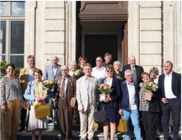
➤ Noces d'or et de diamant 2024, l'émotion au rendez-vous

Renseignements et inscription : 06 87 30 05 68 – evenementiel@ville-mornant.fr