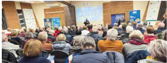
Réunion d'information Miltis le 12 février