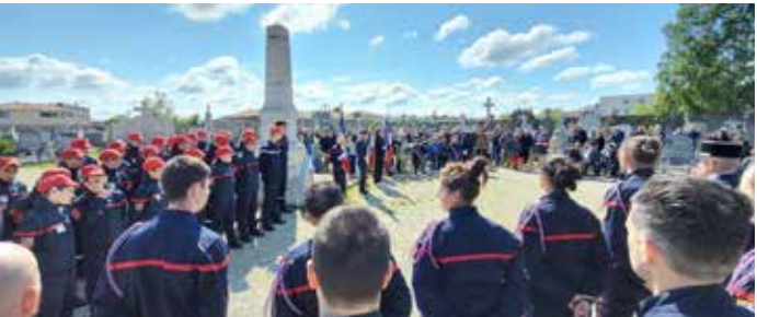
➤ Commémoration 2024 en présence de nombreux pompiers et jeunes sapeurs-pompiers

Nous vous attendons nombreux pour que perdure le devoir de mémoire et que les sacrifices de ces femmes et de ces hommes ne soient jamais oubliés.