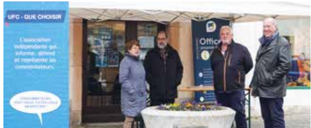
Lancement des permanences UFC Que Choisir le 29 novembre