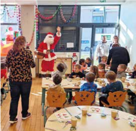
Une visite toujours très attendue

Bien sages, les enfants ont eu droit à une visite surprise : le Père Noël leur a distribué des chocolats, apportant un peu de magie et de joie à cette journée festive. Un moment chaleureux et gourmand que les enfants ne sont pas prêts d’oublier !